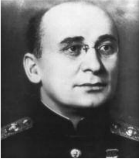
(გაგრძელება წინა ნომრიდან)

სწორედ ეიკემ და ხრუშჩოვმა გამოსტყუეს მაშინ სტალინს ნებართვა, რათა ქვეყანა გაეწმინდათ და მანამდე ელემენტებისაგან, კულაკებისაგან, სხვადასხვა ჯურის კონტრრევოლუციონერებისაგან, ჰქონდათ რა მხედველობაში საკუთარი კეთილდღეობის დაცვა და არა ქვეყანაზე ზრუნვა. ისინი წმენდის ეგიდით გემგანდნენ სისხლიან ანგარიშსწორებას იმ პირების მიმართ, ვინც მათ კეთილდღეობას ეშუქებოდა. საბოლოო მიზანი გახლდათ მთელი ქვეყნის გაღიზიანება და ამის საფუძველზე სტალინის დამხობა და ფიზიკური ლიკვიდაცია. სწორედ ამას ეძღვნებოდა ეჟოვის შეთქმულება, რომელსაც მჭიდრო კონტაქტები ჰქონდა დამყარებული ადგილობრივი პარტიული ორგანიზაციების თითქმის ყველა პირველ მდივანთან. ეჟოვმა ეს კონტაქტები დაამყარა ჯერ კიდევ სკკპ (ბ) ცენტრალურ კომიტეტში მუშაობის წლებიდან.